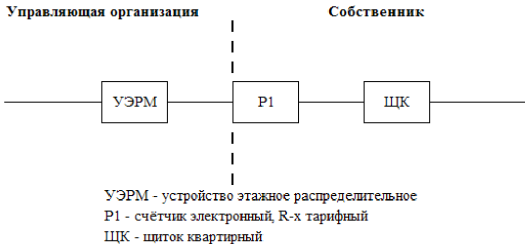
Схема разграничения эксплуатационной ответственности Управляющей организации и Собственника при эксплуатации питающих электрических сетей на квартиру.

УЭРМ - устройство этажное распределительное Р1 - счётчик электронный, R-х тарифный ЦК - щиток квартирный